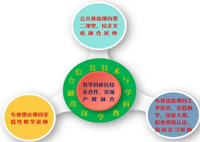
图：“三延伸两融合”教学模式图示

逐步推广翻转课堂、混合式教学、理实一体教学等新型教学模式，加大实践教学力度，做好专业实训教学超过 50%，提高课堂教学质量，强化学生职业技能训练。